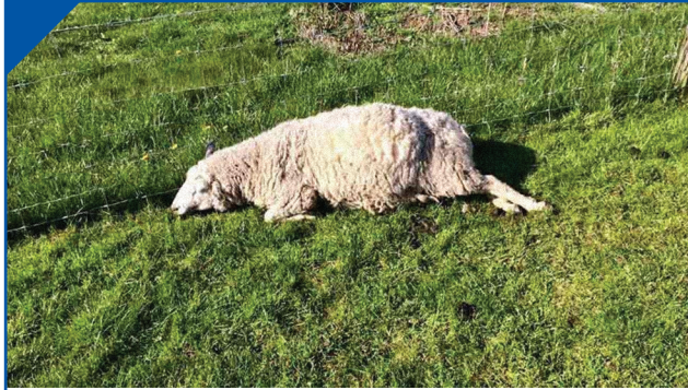
АНОРЕКСИЈА И ДЕПРЕСИЈА ОБОЛЕЛЕ ЖИВОТИЊЕ